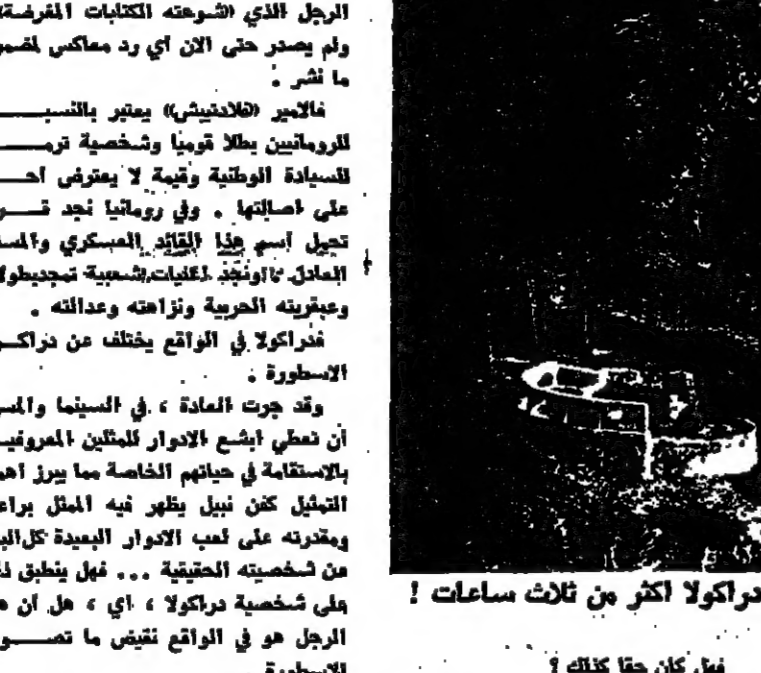
قصر (البران) الذي لم يسكن فيه دراكولا اكثر من ثلاث ساعات!